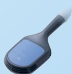
Aplikator dynamiczny Maksymalna indukcja 2.6 T

„Unikalny aplikator dwupolowy odmienił mój sposób leczenia algodystrofii kolan. Od teraz jedno skoncentrowane działanie zastępuje wiele punktowych aplikacji, co pozwala skrócić czas terapii utrzymując doskonale efekty.”