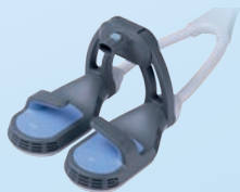
Aplikator dwupolowy Maksymalna indukcja 4.8 T